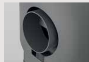
Emplacement pour raccordement air extérieur buse à commander en sus